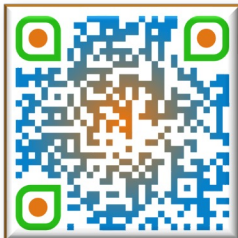
Podcast mit KI erstellt